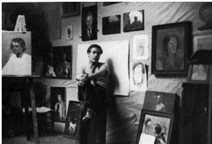
Henri Goetz dans son atelier de la rue Bardinet à Paris en 1934