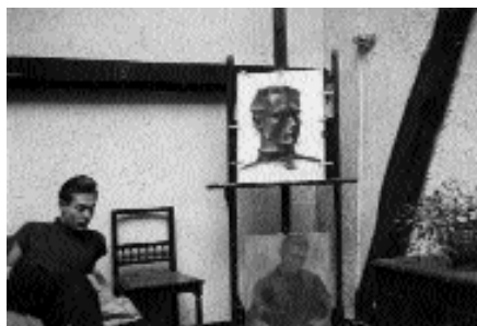
Henri Goetz dans son atelier rue Daguerre