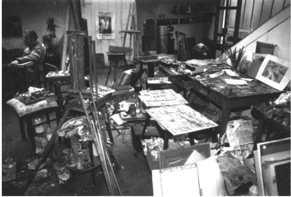
Henri Goetz dans son atelier rue de Grenelle à Paris en 1989