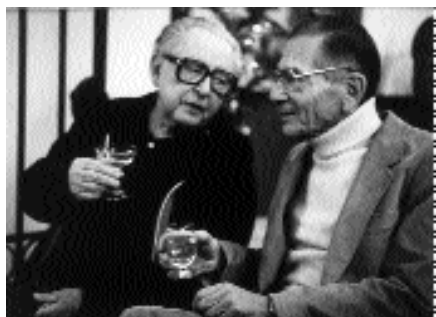
Hans Hartung et Henri Goetz à Villefranche-sur-Mer